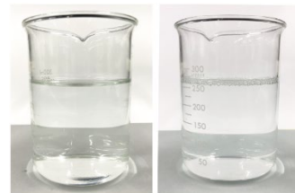
原液 10倍希釈液 アスコート外観