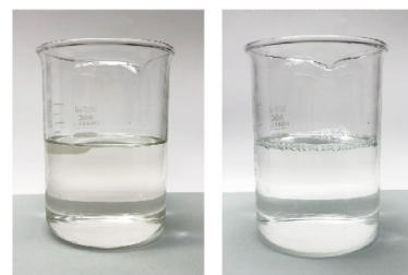
原液 10倍希釈液 アスコートS外観