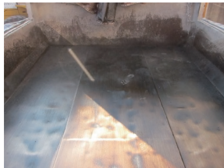
ハイブリット舗装(改質II型)荷下ろし後